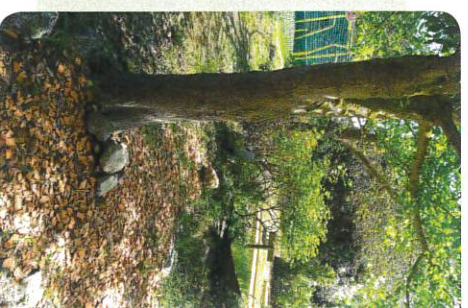
paillage de concassé de briques rouges

Famille Saint-Etienne – Gérants et gestionnaires du camping Les Floralys TEL : 04 68 32 65 65 - www.campinglesfloralys.com