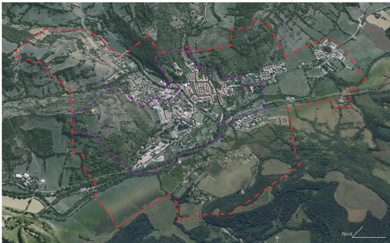
vue aérienne des deux propositions de périmètre SPR CHALABRE - Atelier SKALA - Eve CHAILLAN

- une seconde dite « élargie » qui intègre en outre des lieux extérieurs qu'on peut qualifier d'arrière plans des entités précédentes, comme l'EHPAD, des secteurs pavillonnaires, des zones naturelles et agricoles, ou encore le hameau du Cazal.